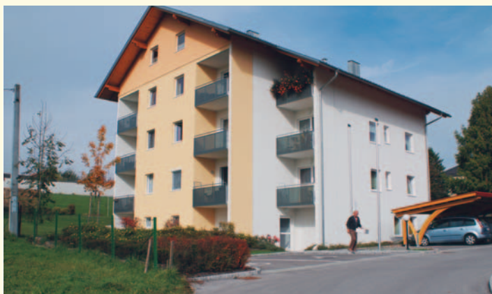
Betreutes Wohnen in Bruckmühl

Otnang, eine Gemeinde in der vieles selbstverständlich erscheint, die Lebensqualität und Zufriedenheit sichert. Eine Gemeinde in der die Daseinsvorsorge keine leere Worthülse ist. Es ist die Gemeinde, die diesem Begriff Inhalt gibt. Wir errichten, bezahlen und warten jene Infrarstruktur, die die Menschen jeden Tag brauchen und nützen. Die Otnanger Gemeinde. Wir schaffen Heimat.