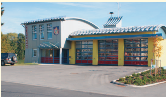
Freiwillige Feuerwehr Ott nang – Neubau Einsatzgebäude

Die ersten urkundlichen Nennungen der Ortschaften der Gemeinde Ott nang, sind unter anderem Grub ca. 1170, Ober/Untermühlau (bzw. Michelau) 1167, Bergern 1188, Bärntal 1215, Walding 1219, Englfing 1230, Redl ca. 1270, Rackering und Stockedt im 13. Jahrhundert, Deisenham, Grünbach, Wiesing und Kropfling 1321, Holzham 1325, Holzleithen und Haus-