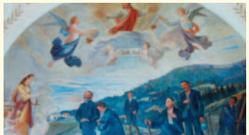
Barbarakirche – Deckengemälde